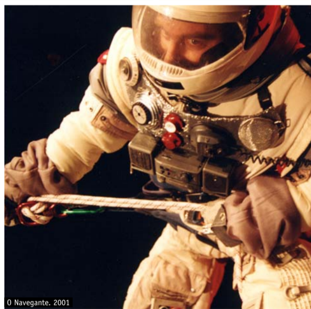
0 Navegante, 2001