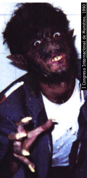
I Congreso Internacional de Monstros, 1990