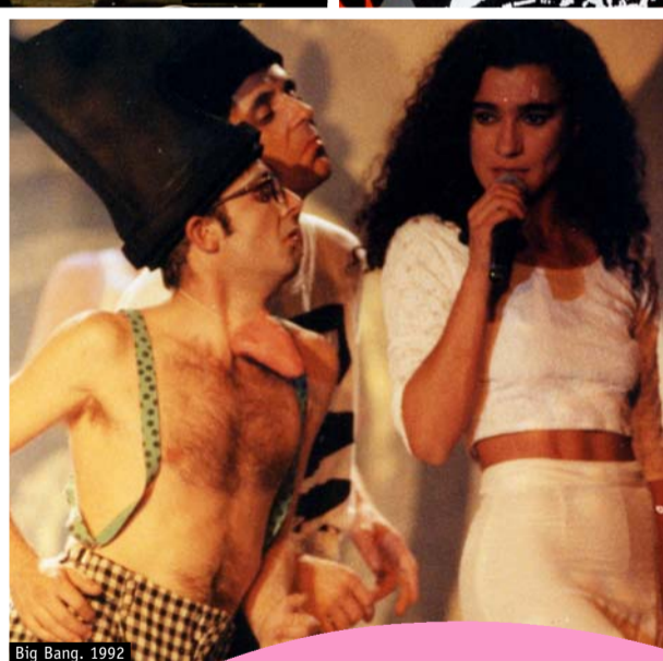
Big Bang, 1992