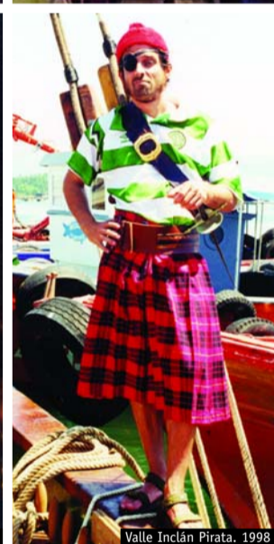
Valle Inclán Pirata, 1998