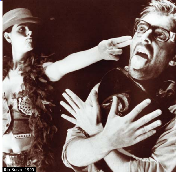
Río Bravo, 1990