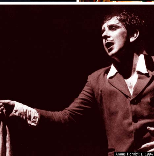
Annus Horribilis, 1994